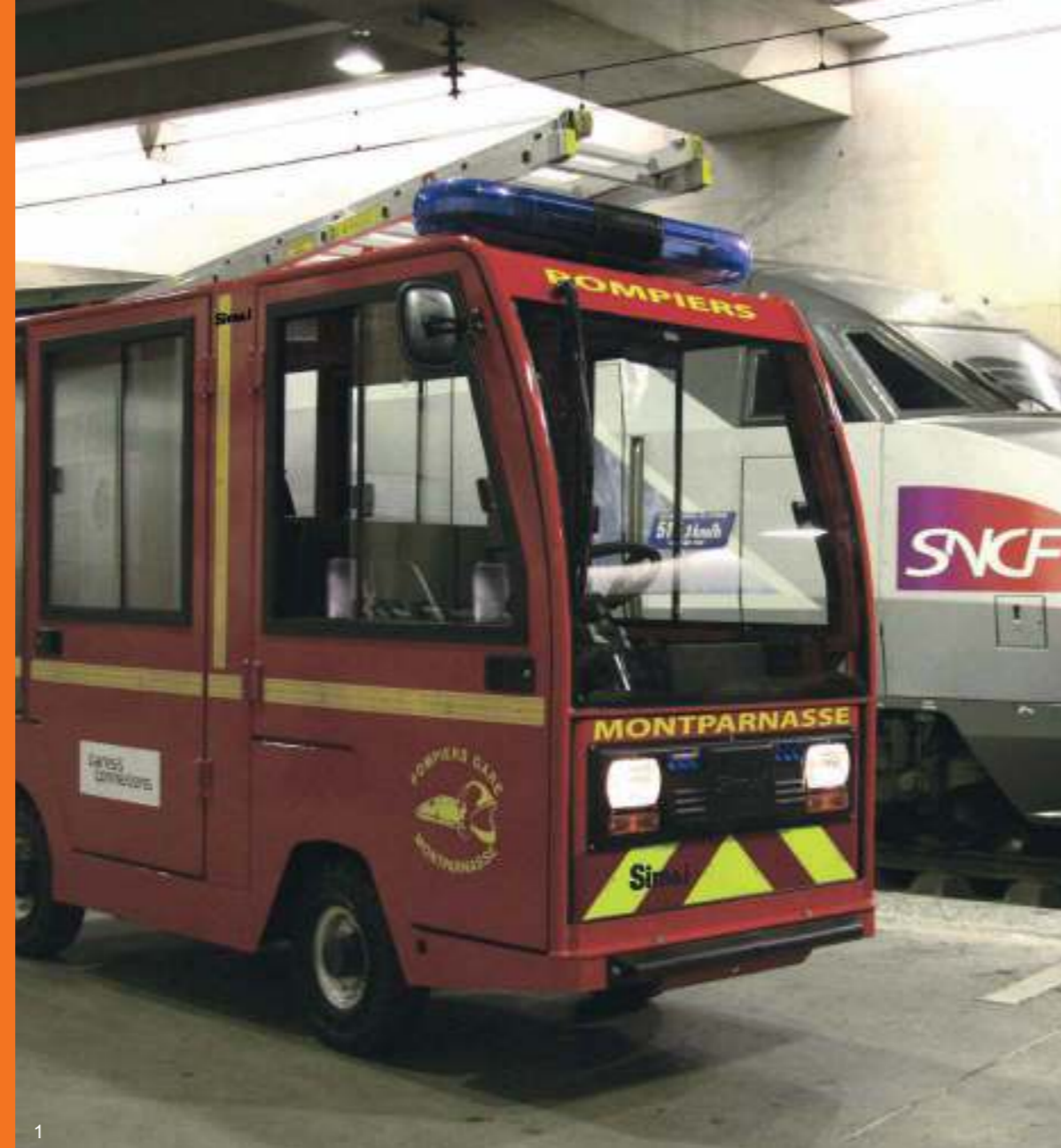
1) SIMAI PPE6VPI - Véhicule de secours SIMAI PPE6VPI - Rettungswagen