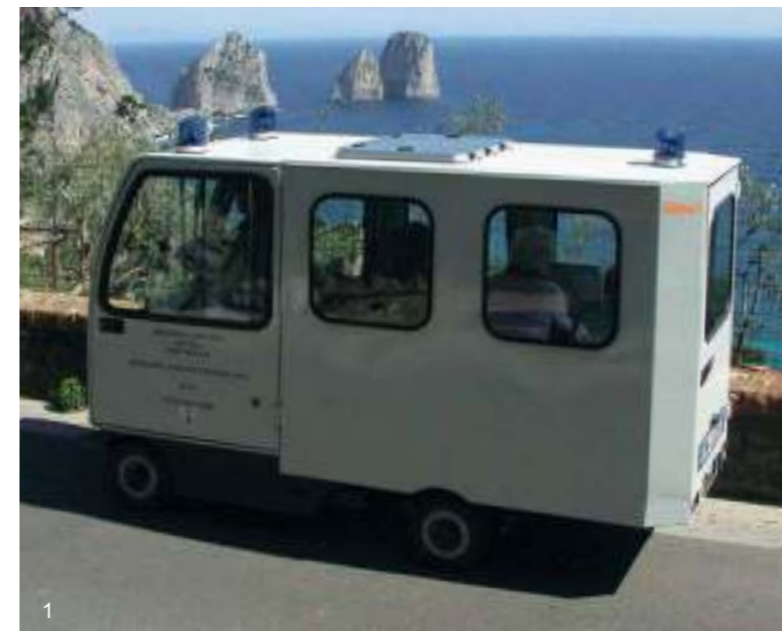
1) SIMAI PE12A - Ambulance électrique pour l'île de Capri SIMAI PE12A - Elektro-Rettungswagen für die Insel Capri