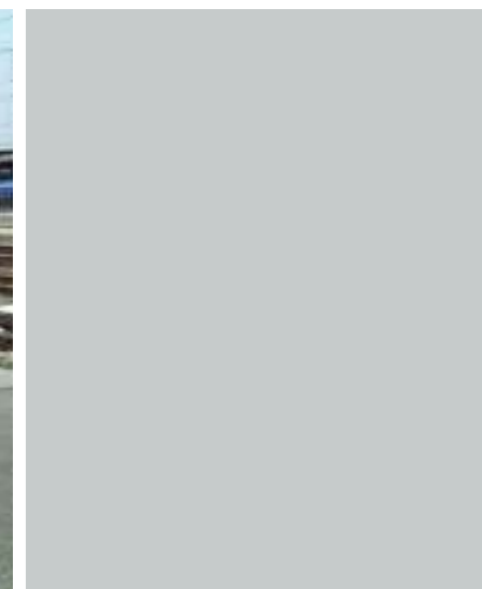
1) SIMAI PRESTO - Table élévatrice pour l'entretien sur les toits des trains Frecciarossa SIMAI PRESTO - Hebebühne für die Dachwartung von Frecciarossa-Hochgeschwindigkeitszügen